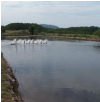
อ่าวคู้งกระเบน