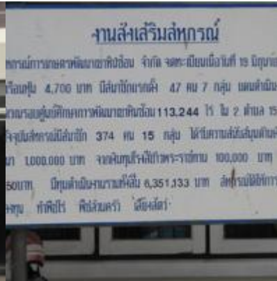
เขาหินซ้อน