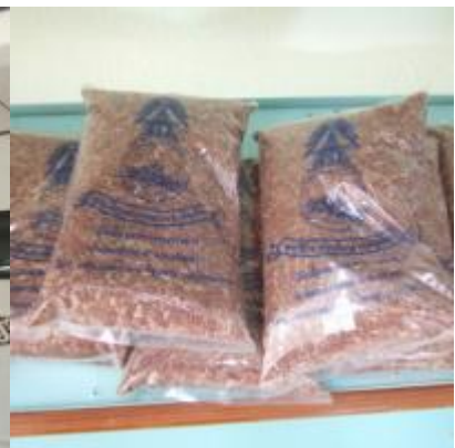
เขาคินซ้อน