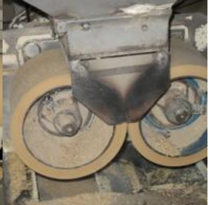
เขาหินซ้อน