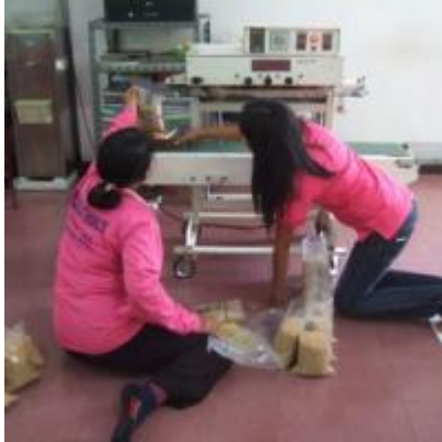
เขาหินซ้อน