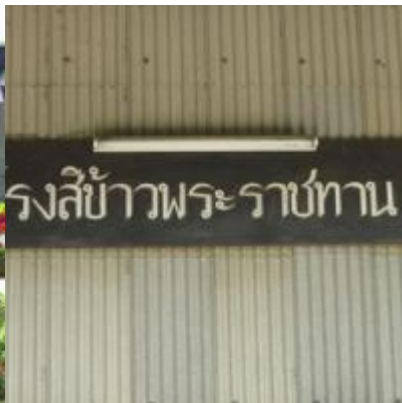
เขาหินซ้อน