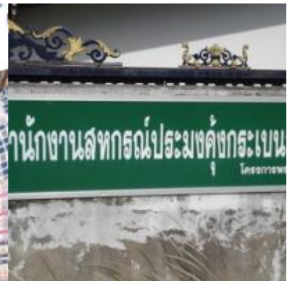
อ่าวคู้งกระเบน