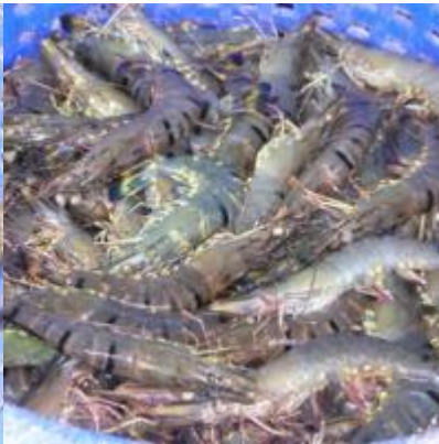
อ่าวคู้งกระเบน