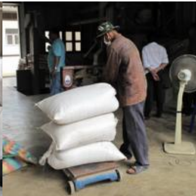
เขาหินซ้อน