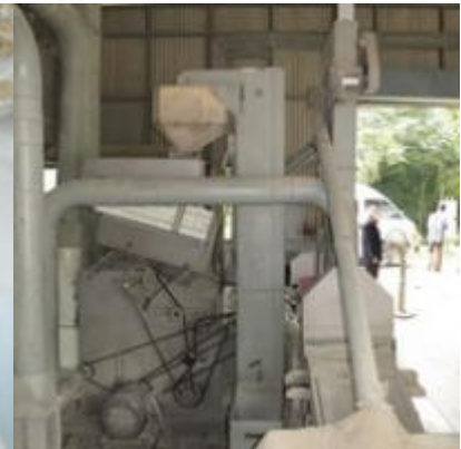
เขาหินซ้อน