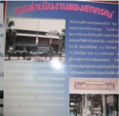
เขาหินซ้อน