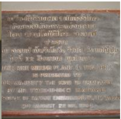
เขาหินซ้อน