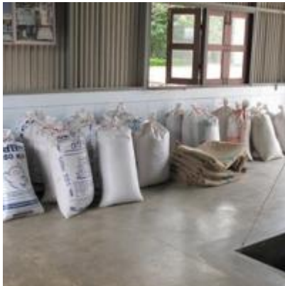
เขาหินซ้อน