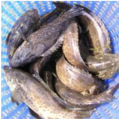
อ่าวคู้งกระเบน