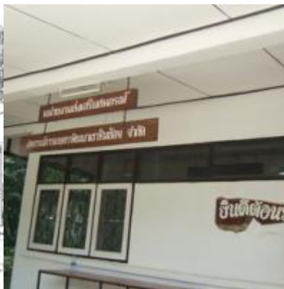
เขาคินซ้อน