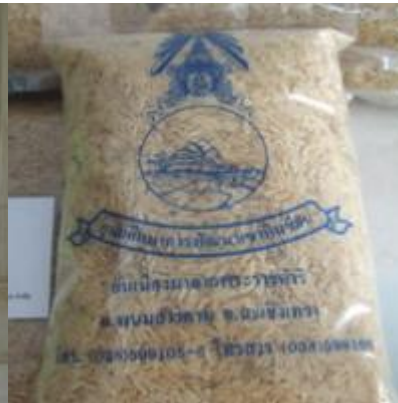
เขาหินซ้อน