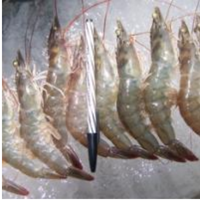
อ่าวคู้งกระเบน