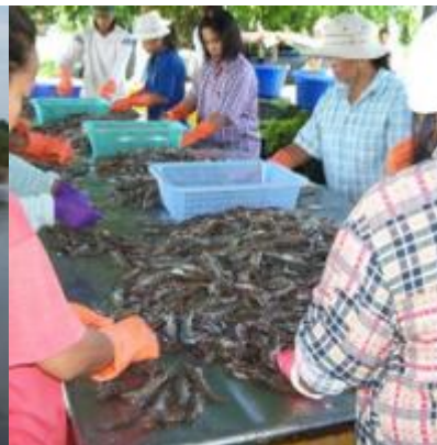
อ่าวคู้งกระเบน