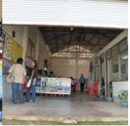
อ่าวคู้งกระเบน