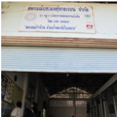
อ่าวคู้งกระเบน