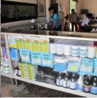
อ่าวคู้งกระเบน