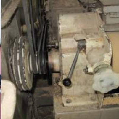
เขาหินซ้อน