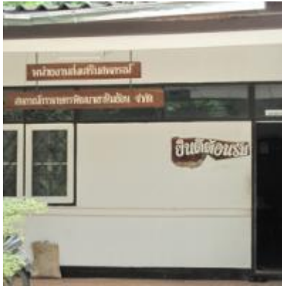
เขาหินซ้อน