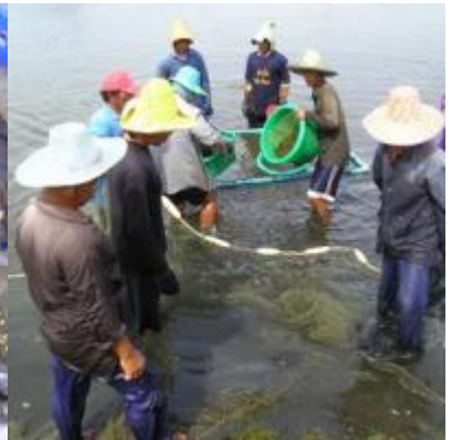
อ่าวคู้งกระเบน