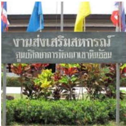
เขาหินซ้อน