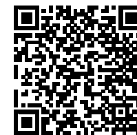
QR Code แบบรายงานการทำธุรกรรม

ภายใน 7 วันนับแต่วันที่มีเหตุอันควรสงสัย วิธีการรายงาน 1) ยื่นต่อเจ้าหน้าที่ ณ สำนักงาน ปง. 2) ส่งไปรษณีย์ลงทะเบียนตอบรับ 3) ส่งผ่านระบบ AERS ของสำนักงาน ปง.