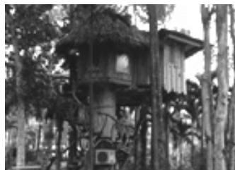
บ้านธารชาน (ผมตั้งชื่อเอง)