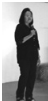
นักร้องแม็กลอง