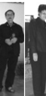
นักร้อง ราชบุรี

ไม่รู้ว่เรานักร้องมีหลายคน โดยเฉพาะกลุ่มราชบุรีร้องกันเก่ง ส่วนคนที่ไม่ถนัด ก็กลับไปเชียร์บอลไทย-อินโดนีเซีย คืนวันที่ 14 ธันวาคม 2559 ที่อินโดนีเซียนำไทยไป 1 : 2 ได้เสียประตูกันอย่างรวดเร็วนำเอาชัยชนะมาอย่างไม่ทันเสร็จ ไทยเสียไป 2 ประตูแล้ว