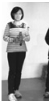
นักร้องเมืองชล