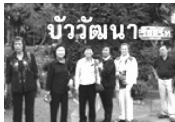
หน้ารีสอร์ต

เราพักกันที่บัววัฒนารีสอร์ท อยู่กับธรรมชาติ บ้านพักแต่ละหลังก็ตั้งชื่อแปลก ๆ เช่น บ้านต้นไม้ บ้านปึกไม้ บ้านโรงนา บ้านรังนกละเมอ เป็นต้น เราถึงรีสอร์ตเกือบค่ำ จึงไม่มีกิจกรรมใด ๆ นอกจากรับประทานอาหารเย็น เมนูปลาและผัก มีเพลงร่วมสมัยขับกล่อม พร้อมนักร้องคาราโอเกะ จากแม็กลอง จากเมืองชล และกรุงเทพ