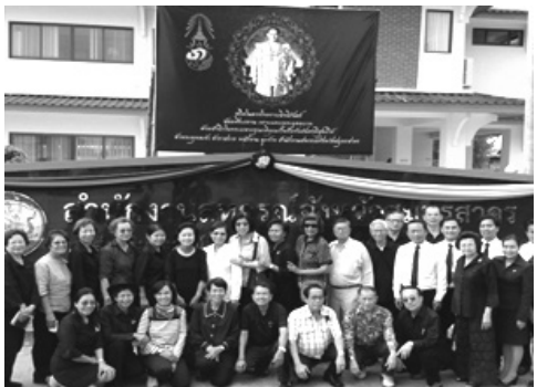
ขอบคุณมากครับ

รูป พระบิดาแห่งการสหกรณ์ไว้เป็นที่ระลึก และ จังหวัดได้มอบเหรียญพระบิดาฯ เป็นที่ระลึกแก่ทุกคน แล้วยังมอบ “ดอกเกลือ” ให้ติดไม้ติดมือกลับไปทุกคน ด้วย