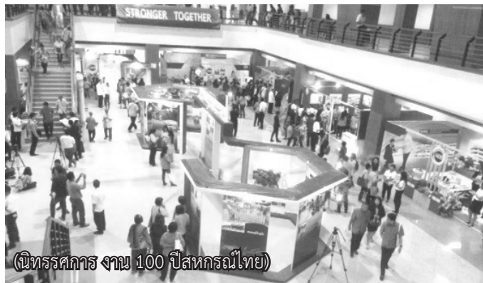
(นิทรรศการ งาน 100 ปีสหกรณ์ไทย)

งาน 100 ปีสหกรณ์ไทย ที่จัดแสดงโดยสหกรณ์ประเภทต่าง ๆ แล้วจึงขึ้นไปห้องประชุม The deck ซึ่งบรรดาผู้แทนสหกรณ์ทุกจังหวัด และส่วนราชการที่เกี่ยวข้องรวม 4,000 คน พร้อมอยู่ หลังจากนำเสนอวิทัศน์ผลงานร้อยปีสหกรณ์ไทย พัฒนาเศรษฐกิจก้าวไกล สังคมไทยมั่นคงแล้ว พิธีกรได้เรียนเชิญ ประธานในพิธี และองค์ปาฐก หัวข้อ “ก้าวผ่าน 100 ปี สหกรณ์ไทย” สรุปได้ดังนี้