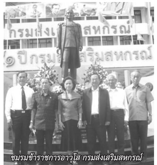
ชมรมข้าราชการอาวุโส กรมส่งเสริมสหกรณ์