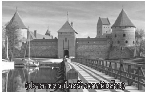
(ปราสาททรากอสสร้างจากหินล้วน)

กลางทะเลสาบเป็นปราสาทมีเงาสท้อนในน้ำ สวยงามมาก อาหารกลางวันเป็นซูปกับสเต็กปลาแซลมอน มื้อที่สอง สเต็กยังอร่อยอยู่ ขนมเค้กที่ไม่เหมือนเมืองไทย