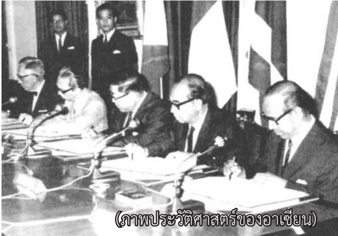
(ภาพประวัติศาสตร์ของอาเซียน)

วันที่ 31 ธันวาคม 2558 เป็นวันที่อาเซียนเป็นประชาคมอาเซียนอย่างเป็นทางการ ขอถือโอกาสแนะนำอาเซียน ให้สมาชิกของชมรมได้ทราบเรื่องราวของอาเซียนที่ควรรู้ ดังนี้