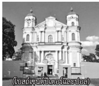
(โบสถ์เซนต์ปีเตอร์และปอล)

หลังอาหารเข้าที่โรงแรม คณะเราก็ออกเดินทางโดยรถบัส เพื่อไปชมโบสถ์ประจำเมือง ซึ่งเป็นโบสถ์ที่สวยงามและครั้งหนึ่งองค์สันตะปาปาก็เคยเสด็จมาชื่อ โบสถ์เซนต์ปอลกับเซนต์ปีเตอร์ ต่อจากนั้นก็ไปชมโบสถ์เซนต์แอนเบอร์นาติน ซึ่งก่อสร้างด้วยอิฐสวยงามมาก จากนั้นก็เดินชมบ้านเรือนไปเรื่อยๆ เพราะทุกบ้านสวยงาม มีศิลปะ ถนนที่เดินก็เป็นถนนโบราณ ที่ปูด้วยหินกลมๆ คณะเราเดินถ่ายรูปกันตลอดทาง ตามไกด์ไม่ทันหรือเพราะไกด์เดินเร็วพูดเร็ว อ้อ ไกด์พื้นเมืองพูดแล้ว ไกด์ไทยแปล ส่วนใหญ่เขาจะพูดกันสองคน เพราะลูกทัวร์มีถ่ายรูป