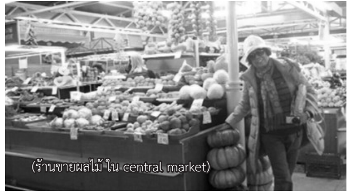
(ร้านขายผลไม้ใน central market)

ออกจากหมู่บ้านสวยงามก็ไปชมตลาด Central market เป็นตลาดขายสินค้าสด เดิมเป็นโกดังเก็บสินค้า เป็นห้องๆ ต่อมาได้มาทำเป็นตลาด แต่ละ