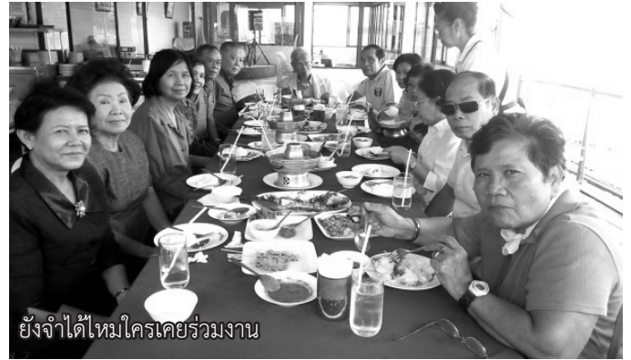
ยังจำได้ไหมใครเคยร่วมงาน