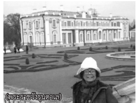
(พระราชวังรุนดาล)

ชาวเยอรมัน เมื่อสิ้นสุดการปกครองของสวีเดน พระราชวังนี้ก็ถูกยกให้แก่เจ้าชายซุบอฟ