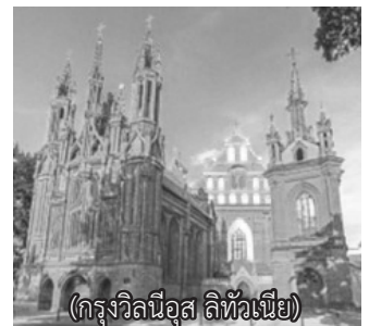
(กรุงวิลเนียอุส ลิทัวเนีย)

เดินทางต่อไปเมืองทราโก เพื่อเข้าชมปราสาท แต่ก่อนจะเข้าชมก็แวะรับประทานอาหารกลางวัน ที่ร้านมีบรรยากาศที่สวยงามมากเพราะอยู่ริมทะเลสาบ