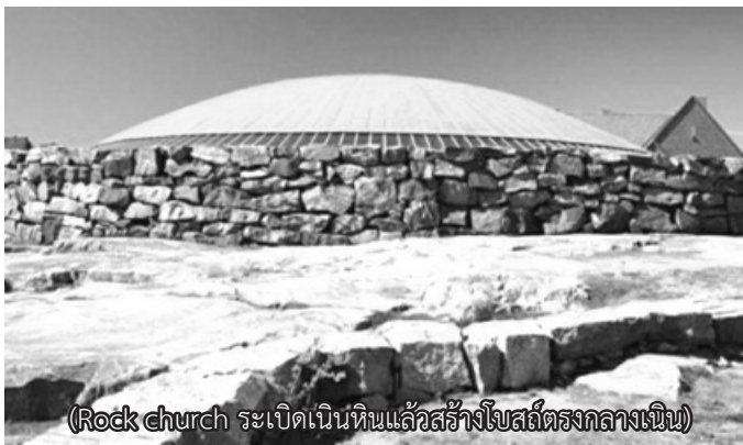
(Rock church ระเบิดเนินหินแล้วสร้างโบสถ์ตรงกลางเนิน)

ออกจากจัตุรัสไปริมาอ่าว เป็นตลาดยามเช้าเล็กๆ ขายผลไม้ เสื้อผ้า และหมวกพื้นบ้าน จากนั้นไปชมโบสถ์หินที่ใหญ่ที่สุด ตัวโบสถ์ขุดลงไปใถภูเขาและใช้ขอบหินภูเขาเป็นหลังคา ซึ่งเป็นความสามารถที่น่าอัศจรรย์ของคนสร้าง เมื่อได้เวลาประมาณ 10.00 น. ที่หลายคนรอคอยห้างเปิด เขาปล่อยให้อิสระประมาณ 2 ชั่วโมง ในการ ชอปปิ้ง