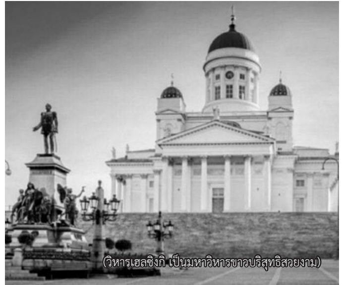
(วิหารเฮลซิงกิ เป็นมหาวิหารชาวคริสต์ที่สวยงาม)

ฟินแลนด์ใช้ภาษาฟินนิชและสวีดิช เมืองหลวงชื่อเฮลซิงกิ อาหารพื้นเมืองขนานแท้คือ เนื้อกวางเรนเดียร์ ใช้เงินสกุลยูโร ระบบไฟฟ้า 230 โวลท์ หลัง