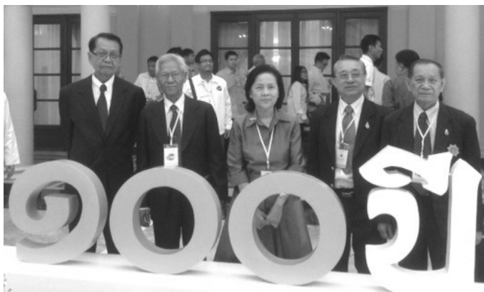
สหกรณ์ไทย ไว้ให้ถ่ายรูปเป็นที่ระลึก