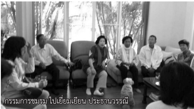
กรรมการชมรม ไปเยี่ยมเยียน ประธานवरณี