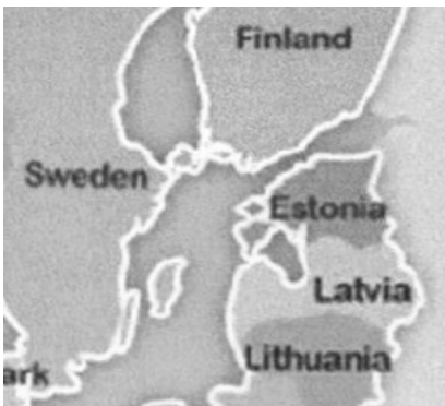
ฟินแลนด์ สวีเดน เอสโตเนีย ลัตเวีย ลิทัวเนีย

ประเทศลิทัวเนีย ลัตเวีย และเอสโตเนีย ไม่มีสถานทูตในเมืองไทย ดังนั้นต้องไปทำวีซ่าที่สถานทูตเยอรมัน การเดินทางมีสายการบินลงได้หลายประเทศ เช่น สวีเดน เดนมาร์ก หรือ ฟินแลนด์ คณะเราเลือกลงที่ฟินแลนด์ โดยสายการบินฟินน์แอร์ ซึ่งค่าใช้จ่ายจะถูกกว่าไปลงที่ประเทศอื่น ประเทศในเขตบอลติกมีเวลาที่แตกต่างกัน ช้ากว่าประเทศไทย 5 ชั่วโมง สภาพอากาศหนาวประมาณ 6 เดือน หนาวที่สุดเดือนธันวาคม -มกราคม ขณะที่อยู่เวลานี้อุณหภูมิ 5-7 องศาเซลเซียส