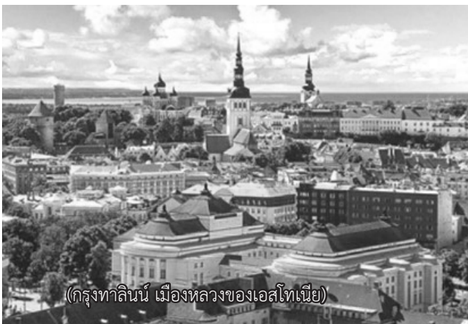
(กรุงทาลินน์ เมืองหลวงของเอสโตเนีย)

แต่ว่าพระองค์ยังไม่เคยได้เสด็จมาประทับเลย ปัจจุบัน จึงได้จัดเป็นพิพิธภัณฑ์ มีภาพถ่ายโบราณที่หาค่ามิได้ ของราชวงศ์รัสเซีย เปิดให้ประชาชนเข้าชม ภายใน สถาปัตยกรรมไม่ค่อยหรูหรา เรียบๆ ธรรมดา แต่ภาพ ที่ประดับ สวยงามมาก ชมวังเสร็จประมาณ 16.30 น. ข้างนอกมีตสนิท ฝนตกพริ้วๆ เดินกลับไปขึ้นรถซึ่งอยู่ ไกลมาก กว่าที่จะถึงรถก็น้ำมูกย่อย เวลายังไม่เย็นมาก นักยังไม่ถึงเวลาอาหารเย็น จึงไปเดินช้อปปิ้งตามห้าง ส่วนใหญ่ก็จะซื้อได้แต่เสื้อกันหนาวกับช็อคโกแลต และ ของที่ระลึก โรงแรมที่พักอยู่หน้าห้าง จึงถือโอกาสเข้า พักโดยไม่ไปกินอาหารเย็น