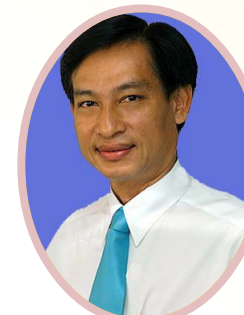
โอกาส กลั่นบุศย์ ผู้ตรวจราชการกรม