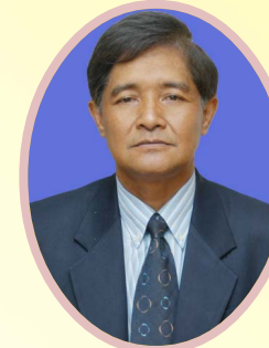
จิตรกร สามประดิษฐ์ รองอธิบดีกรมส่งเสริมสหกรณ์