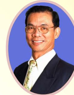
ปราโมช กาวร รองอธิบดีกรมส่งเสริมสหกรณ์