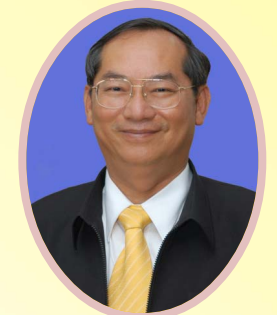
ประเสริฐ โกศัลวิตร รองอธิบดีกรมส่งเสริมสหกรณ์