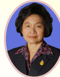
สุพิศรา รัตนวัฒน์ อธิบดีกรมส่งเสริมสหกรณ์