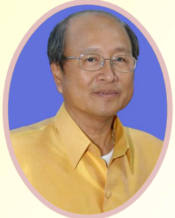
ศักชาย อินโชนนท์ เลขาธิการกรม